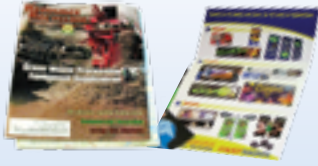
revistas, folletos, periódicos y catálogos