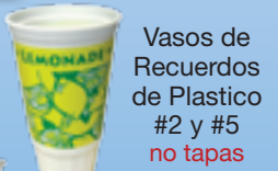
Vasos de Recuerdos de Plastico #2 y #5 no tapas

Coloque materiales reciclables sueltos y sin bolsa en su bote de reciclables.