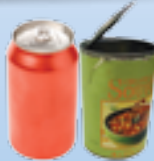
botes y latas no aplastar