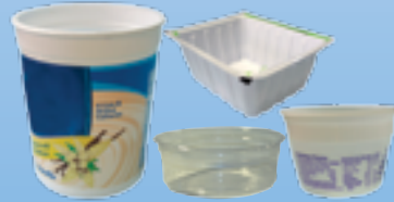
Recipientes no tapas