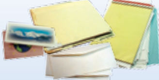
tarjetas, correo abierto, papel de oficina, carpetas y planos no papel de color neón o papel cartulina