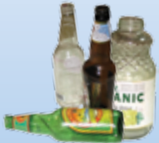
botellas y frascos de vidrio no fichas en botellas