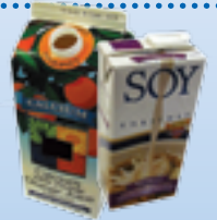
envases de leche y cartones de jugo no envases con lámina interior de aluminio no aplastar