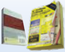
libros de tapa blanda