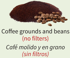
Coffee grounds and beans (no filters) Café molido y en grano (sin filtros)