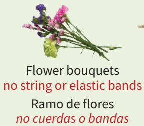
Flower bouquets no string or elastic bands Ramo de flores no cuerdas o bandas