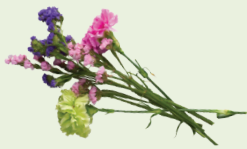
Flower bouquets no string or elastic bands