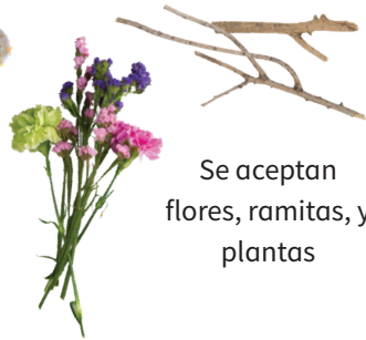
Se aceptan flores, ramitas, y plantas