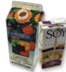
Envases de leche y otras bebidas (no envases con lámina interior de aluminio)