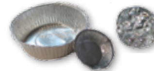
Envases de aluminio y bolas de papel de aluminio