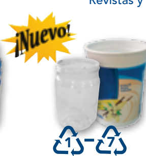
Envases plásticos #1-#7 (no tapas, no #7 PLA biodegradables)