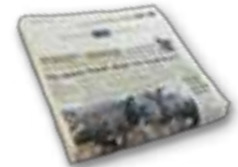
Periódicos y propaganda insertada