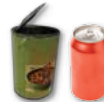
Latas (no aplastar)