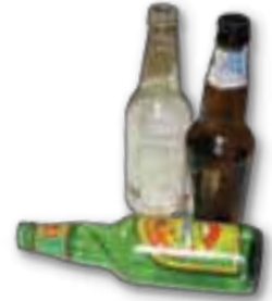
Botellas de vidrio