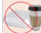
Envases de poliestireno y envases y vasos para comida rápida