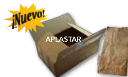
Cartón y bolsas de papel