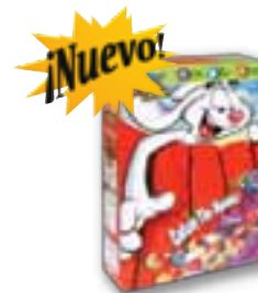
Cajas de papel cartón