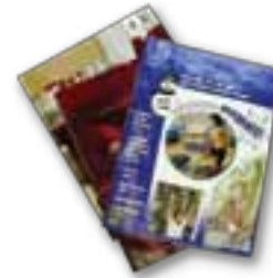
Revistas y catálogos