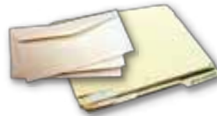
Papel de oficina, carpetas y correo abierto

Favor de colgar/pegar esta sección en su refrigerador (o cerca de su contenedor de reciclaje).