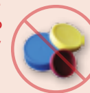
Tapas de plástico