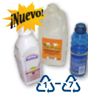
Botellas plásticas #1-#7 (no tapas, no #7 PLA biodegradables)